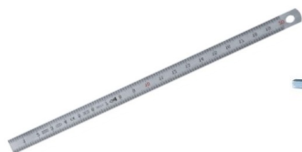
Réglét inox 300 mm