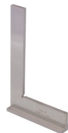
Equerre à chapeau de mécanicien

Pour information, avec le Pass'Régiion, l'équipement professionnel est en partie pris en charge financièrement par la Région Auvergne Rhône-Alpes à la hauteur de 100€ pour l'entrée en Bac Pro REMI et 100€ pour l'entrée en 1 ère TCI. https://jeunes.auvergnerhonealpes.fr/202-financement-equipement-professionnel.htm